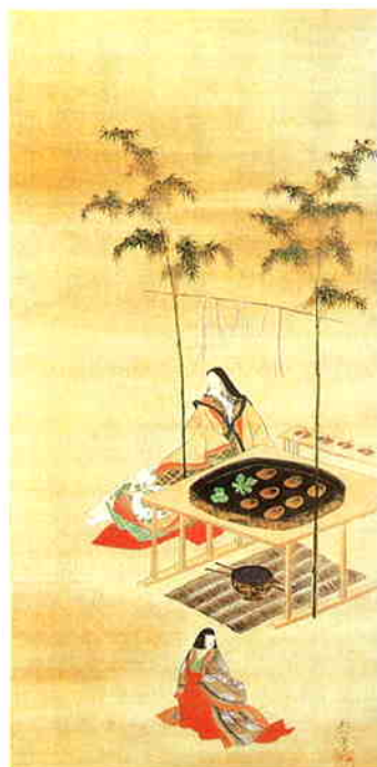
(図) 酒井抱一 五節句ノ内 七夕ノ図

たらいに水をはり、二星を水 に映し琴を奏でたといわれ (図参照)ます。笹竹に五色の 糸をさげ諸芸の上達を願った 乞巧奠は江戸時代に最も盛に 行われた様で、後水尾院も寛 永十年(一六三三)に七夕七遊 を催し、香立花、和漢聯句、 詩、和歌、管絃、囲棋象戯の 七種の遊びを行いました。 香りは星の光と少し似かよ う所があるように思えます。 体験された方はおわかりかと 存じますが、香りと心をはひ そめなければ聞きとれない程 かそけくひそやかなもので一 寸心をそらすと逃げて行つて しまいます。 星のきらめきや虫の声のよ うにもろく繊細で、強烈な自 己主張など少しもない透明な 美しさなのですから。