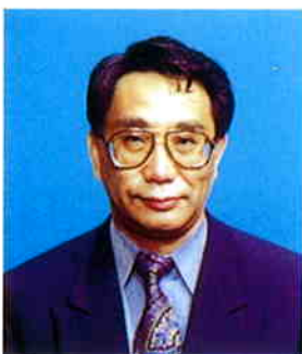
(なごやメンタルクリニック院長、 心療内科・神経科 赤坂クリニック 理事長)

者、臨床医、研究者がどの ように協力し、活動してい るかまた不安症の診療上の 問題点を講演しました。わ たしは、日本でもA D A A のような会の必要性を感じ ていました。既に名古屋で は六月十五日、恐怖症患 者・家族の会「アグラ会」 が第三回を迎えます。七月 十三日には東京で不安の医 学 第二回都民講演会「テ ーマ パニック障害」の講 演会終了後患者・家族の討 論会が開かれる予定です。 これらの会がどんどん育ち A D A Aに優るとも劣らな い活動を繰り広げ、不安症 に悩む患者さん達の治癒へ の道しるべとなることを期 待しています。