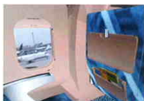
写真2 飛行機の客席から外を眺めている情景。バーチャル・リアリティは視野が360度得られる。