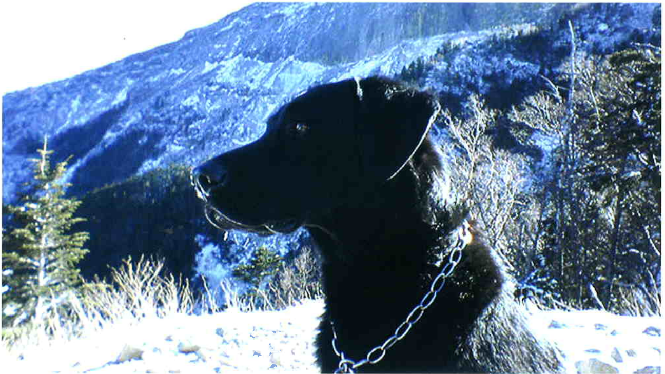
愛犬と冬の山登り