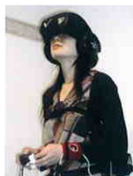
写真1 バーチャル・リアリティを体験しながらポリグラフで身体的不安症状(脈拍、発汗、体温など)をモニターする。

大ニュースジャ！恐怖症の新しい治療が始まりました。それはコンピュータネットワークが形成する情報空間を利用した治療施設です。コンピューターソフトにより3次元空間を作り、エクスポージャー療法が出来るようになった。エクスポージャー療法とは、恐怖場面や不安場面に臨み、その際の不安感をコントロールしていくことによって、徐々に恐怖や不安を低減させていくという非常に効果が高い治療法だ。現実の場面に行かなくてもヴァーチャル・リアリティを利用して治療が出来るようになった(写真1)。治療対象は、パニック障害に伴う地下鉄など乗り物恐怖、飛行機恐怖、高所恐怖、雷恐怖、風恐怖、クモ恐怖、ガ恐怖、対人恐怖、スピーチ恐怖などジャ。